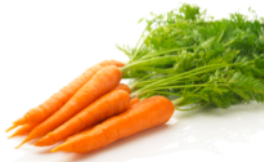
Karotten (natürliches Beta-Carotin)

Ergänzt werden die o. g. Inhaltsstoffe durch unsere speziell ausgewählten und kombinierten Obst-, Gemüse- und Pflanzenextrakte: