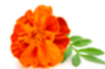
Tagetes-Extrakt (Lutein und Zeaxanthin)