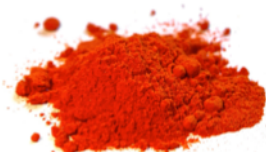
Dunaliella-Alge (natürliches Beta-Carotin)