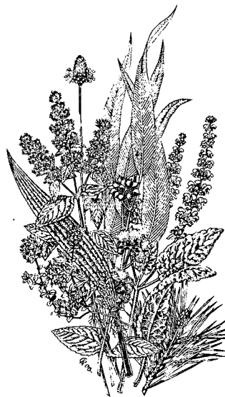
Heilpflanzen im WALA-Garten